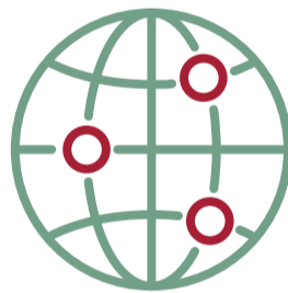
Pays de Naissance